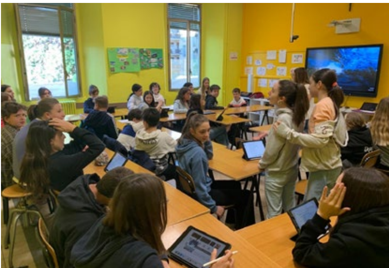
Ein Besuch in der Schule in Varese