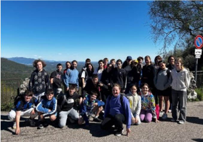
Eine gelungene Woche für die Schülerinnen und Schüler aus Malans und Varese

Bericht: Sibylle Süess