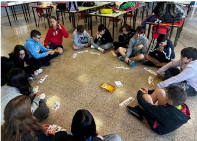
Sprachspiele, um sich kennenzulernen

Gemeinsam lachen, gemeinsam eine Präsentation vorbereiten, gemeinsam zeichnen, gemeinsam Sport machen, gemeinsam singen, gemeinsam staunen, sich gemeinsam in der Fremdsprache unterstützen, gemeinsam Theater spielen, gemeinsam die Unterschiede vom Schulsystem in Varese und Malans erleben, gemeinsam kochen und gemeinsam die Gegend von Malans und Varese erkunden.