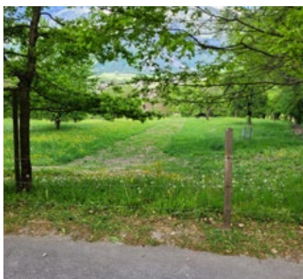
Modernisierung der Wasserleitung Bannholz während Bauarbeiten (links) und nach Bauende (rechts)

Seit der Errichtung im Jahr 1902 hat die alte Wasserleitung, die Malans mit Trinkwasser versorgt, nun ausgedient. In enger Zusammenarbeit mit der örtlichen Gemeindeverwaltung und unter der fachkundigen Leitung Donatsch + Partner AG mit der Baufirma Zindel + Co. AG und des Sanitärunternehmens Aquagriska AG wurde die