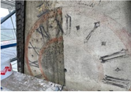
Kirchturm: Reinigung Giebel Nord

halten werden soll. Deshalb beschlossen die Kirchgemeindeversammlung am 6. November und die Gemeindeversammlung am 5. Dezember 2022 die Durchführung der Restaurierung des Kirchturms unter der Leitung von Architektin Marlene Gujan, Architektur AG, Igis. Zur «Turm-Bekrönung» gehören die folgenden Gegenstände: Wetterhahn, Breite 600 mm; Kreuz, Breite 2300 mm; Kugel, Durchmesser 500 mm; 4 Wasserspeier, Länge 800 mm, Höhe 600 mm, Flügelspannweite 900 mm; Die vier Zeigerpaare für die Zeitangabe.