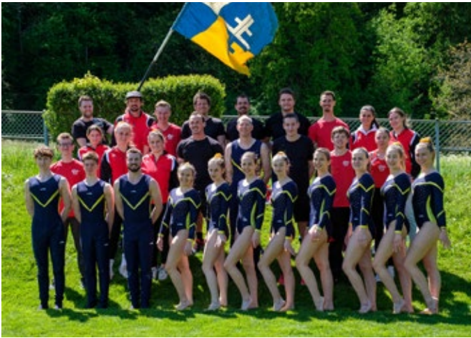
TV Malans am Vorbereitungsturnen in Wangs